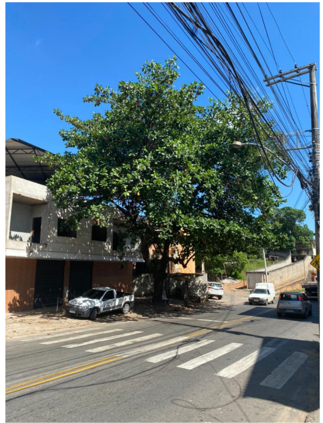
Figura 5. Visão geral da castanheira da praia. Leve conflito dos galhos com a fiação do outro lado da via pública.

Os conflitos causados pela árvore com os elementos urbanos mencionados acima podem ser solucionados através da realização de poda de limpeza e da adequação da área livre permeável. Desta feita, sugere-se o indeferimento do pedido de supressão.