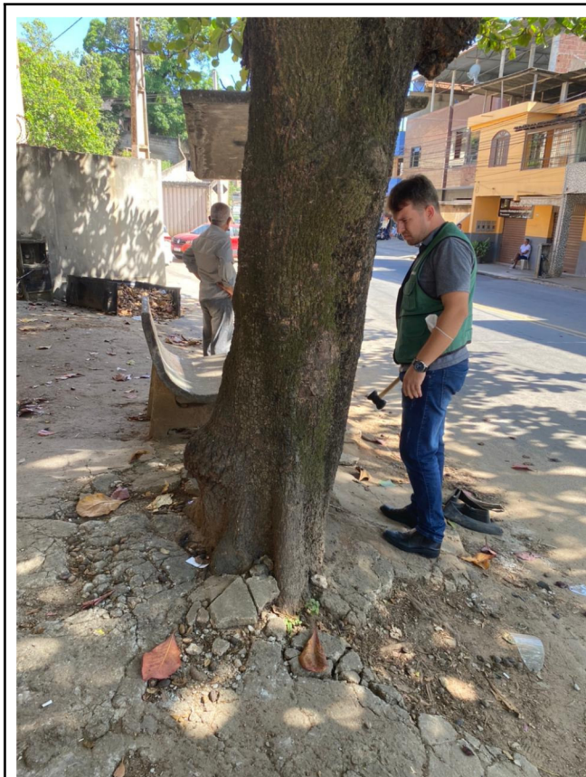
Figura 2. Sistema radicular causando rachaduras no passeio.

A copa da castanheira está vigorosa, ofertando ótima sombra. Alguns galhos estão conflitando com a telha da residência, trazendo transtorno ao morador. Verificou-se também que o sistema radicular da árvore está quebrando o passeio.