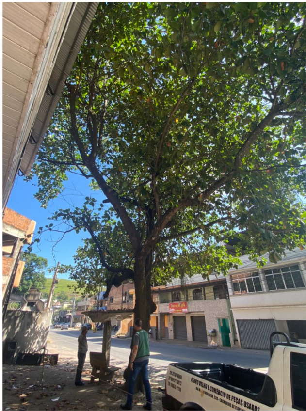
Figura 4. Visão geral da castanheira da praia. Observa-se um pequeno conflito dos galhos com a telha da residência do munícipe.

Rua Agripino de Oliveira, 60, Independência, Cachoeiro de Itapemirim, ES, CEP: 29306-450 Tel: (28) 3155-5327 / e-mail: semma@cachoeiro.es.gov.br site: www.cachoeiro.es.gov.br/servicos