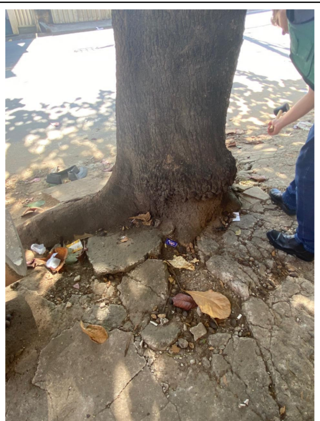
Figura 3. Sistema radicular causando rachaduras no passeio.