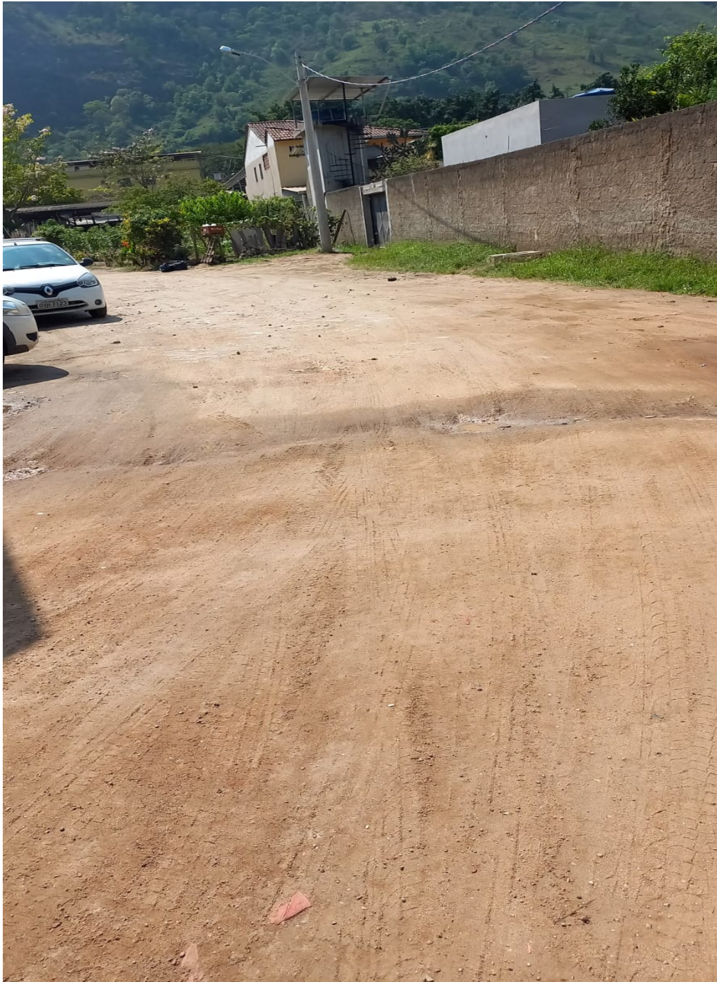
“Feliz a Nação cujo Deus é o Senhor”