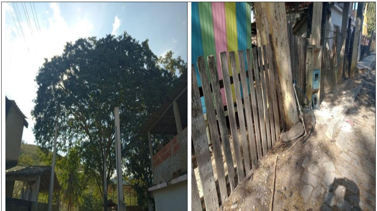
Figura 2. Espécie arbórea: Pau-ferro ( Libidibia ferrea ) e suas imagens no ambiente circundante.

É necessário sim, para árvore de grande porte: serviço de poda leve com objetivo de limpeza de ramos mortos e conformação da parte aérea, reequilibrando dessa forma a copa, bem como a força peso do pau-ferro, estabilizando assim, tal ângulo de inclinação e, prevenindo mais danos aos elementos construídos ao redor e em direção a via com sua calçada estreita (Figuras 2 e 3).