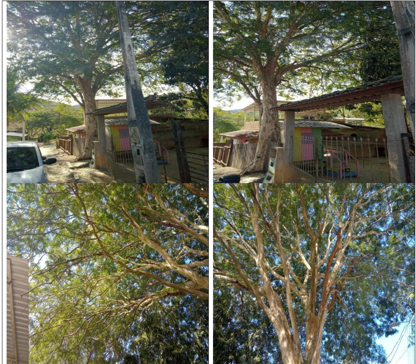
Figura 3. Espécie arbórea: Pau-ferro ( Libidibia ferrea ) e suas imagens no ambiente circundante.

Rua Agripino de Oliveira, 60, Independência, Cachoeiro de Itapemirim, ES, CEP: 29306-450 Tel: (28) 3155-5327 / e-mail: semma@cachoeiro.es.gov.br site: www.cachoeiro.es.gov.br/servicos