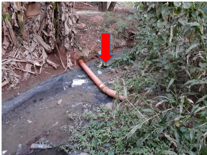
Foto do reparo da rede

Em vistoria no dia 14/06/2021 no bairro Monte Belo na rua da antiga piscina do raed, foi identificado uma tubulação rompida devido a golpes de alguma ferramenta perfurante, esse rompimento segundo os próprios moradores que acompanharam a vistoria relata que os oportunos realizaram essa manobra afim e evitar o retorno de esgoto para suas residências. Esse retorno se deve as ligações irregulares de águas pluviais das residências na rede de esgoto.