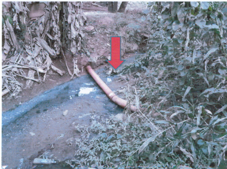
Foto do reparo da rede

Em vistoria no dia 14/06/2021 no bairro Monte Belo na rua da antiga piscina do raed, foi identificado uma tubulação rompida devido a golpes de alguma ferramenta perfurante, esse rompimento segundo os próprios moradores que acompanharam a vistoria relata que os oportunos realizaram essa manobra afim e evitar o retorno de esgoto para suas residências. Esse retorno se deve as ligações irregulares de águas pluviais das residências na rede de esgoto.