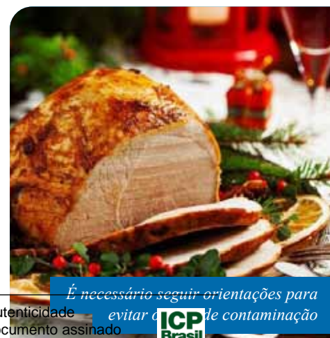
É necessário seguir orientações para evitar a contaminação

– Sintoma da doença, por mais leve que seja, também não podem participar. Lembrando que os principais sinais são: dor de garganta, coriza, tosse, febre, dor muscular e, em algumas ocasiões, perda do paladar e olfato.