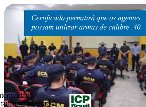
Certificado permitirá que os agentes possam utilizar armas de calibre .40

“A conclusão desse curso é mais um avanço para a melhoria da qualidade da segurança pública de Cachoeiro. Estamos muito felizes por mais essa conquista da categoria, que é tão importante para o município”, salientou o prefeito Victor Coelho.