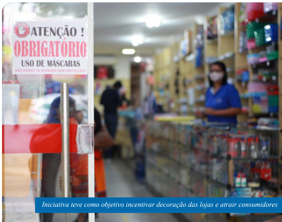
Iniciativa teve como objetivo incentivar decoração das lojas e atrair consumidores

“Este ano foi turbulento, principalmente para os comerciantes. As luzes coloridas e as decorações natalinas espalham esperança