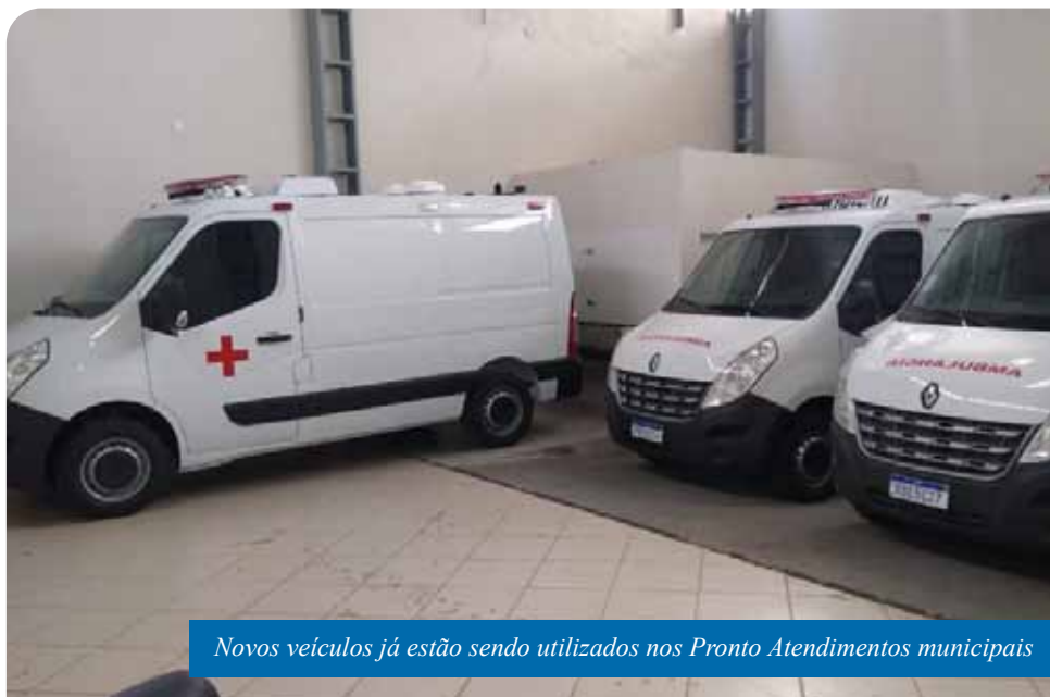
Novos veículos já estão sendo utilizados nos Pronto Atendimentos municipais

Na semana passada, a Prefeitura de Cachoeiro assinou o contrato para a instalação de uma base do Serviço de