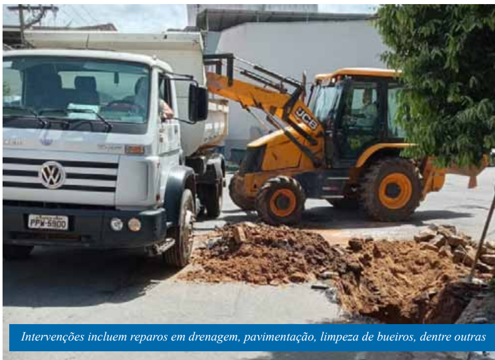
Intervenções incluem reparos em drenagem, pavimentação, limpeza de bueiros, dentre outras

Outro trabalho importante desse período é o apoio à Secretaria Municipal de