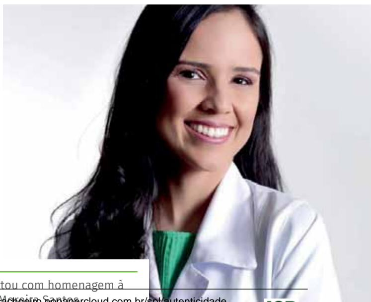
Solenidade contou com homenagem à