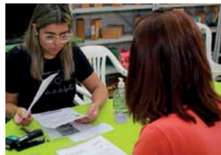
Atendimentos foram realizados na escola estadual “Wilson Rezende”

A gerência de Habitação da Semurb funciona na rua João Monteiro, 33, bairro Ferroviários, embaixo da Escola Municipal “Anacleto Ramos”. Mais esclarecimentos podem ser obtidos pelo telefone: (28) 3155-5200.