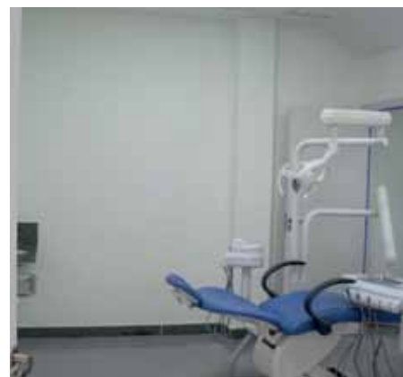
Odontologia é uma das especialidades que serão ofertadas no local