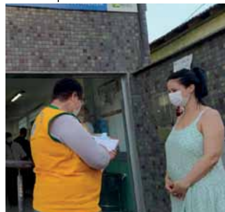
Novo valor foi estabelecido pela Emenda Constitucional 120

nos últimos anos, como o novo plano de carreiras e o auxílio alimentação”, lembra o prefeito.