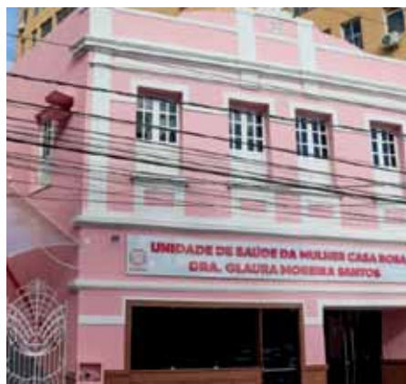
Local concentrará diversos serviços voltados ao público feminino

No local, serão ofertados serviços como salas para vacinas e testes rápidos, fisioterapia, odontologia, ultrassonografia, ginecologia, clínica geral, psicologia e nutrição, dentre várias outras áreas, além de um auditório para palestras.