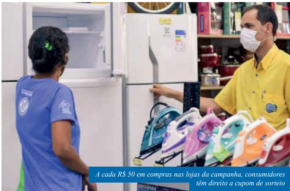
A cada R$ 50 em compras nas lojas da campanha, consumidores têm direito a cupom de sorteio

“Mesmo em um cenário tradicional, o setor lojista já enfrenta muitos desafios para se manter competitivo no mercado. Em um período tão desafiador como está sendo para todos nós este ano de 2020, em que os comerciantes sofreram com a enchente de janeiro e com os impactos da pandemia de Covid-19, essa campanha, por certo, fomentará a atividade do comércio varejista em nossa cidade”, salienta o secretário municipal de Desenvolvimento Econômico, Francisco Montovanelli.