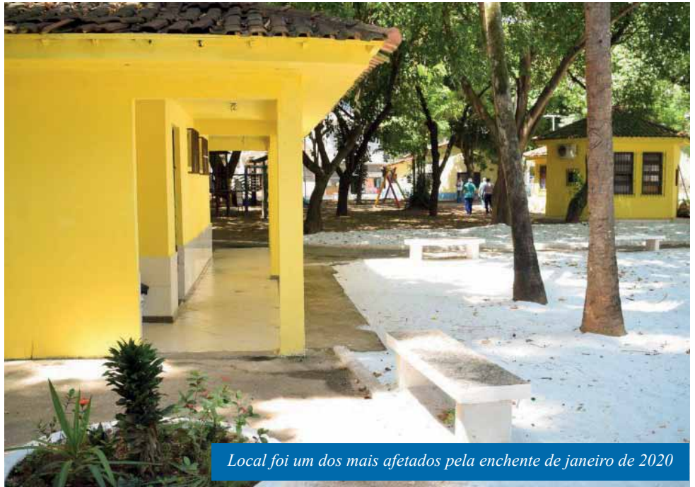
Local foi um dos mais afetados pela enchente de janeiro de 2020

“A Praça de Fátima é um marco de Cachoeiro e, por isso, que esse serviço é tão importante. Queremos que esse local, tão querido por cachoeirenses e visitantes, volte a ficar bonito e seguro. Trabalhando com responsabilidade, estamos reparando os danos causados pela maior enchente da história de Cachoeiro, que deixou