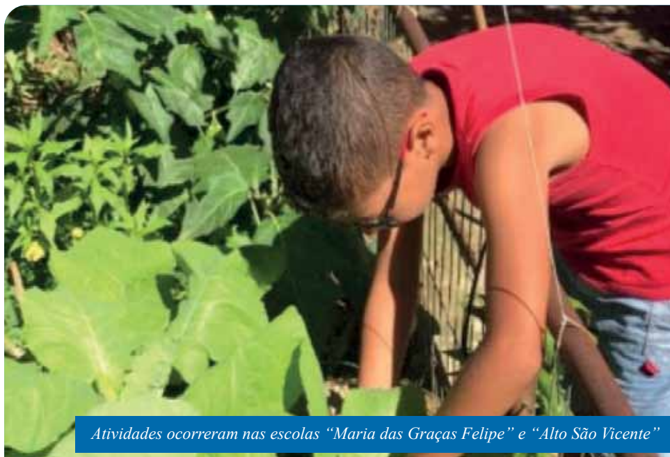
Atividades ocorreram nas escolas “Maria das Graças Felipe” e “Alto São Vicente”

As ações contaram com a participação da comunidade, por meio dos pais e responsáveis. As unidades de ensino utilizaram todos os espaços pertencentes ao prédio escola; reutilizaram vasos; usaram a água do ar-