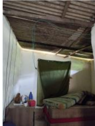
Figura - 06