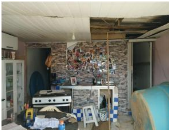
Figura - 02