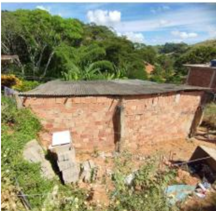
Figura - 01