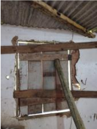
Figura - 04