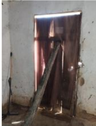
Figura - 05