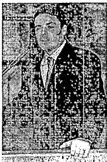
Deputado(a) Glauber Coelho Partido PSB