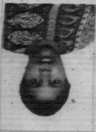
CACHOEIRO DE ITAPEMIRIM