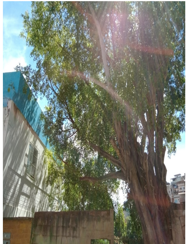
5.3. Visão frontal da árvore inclinada em direção a escola com ramos que encostam e causam danos na cobertura predial.