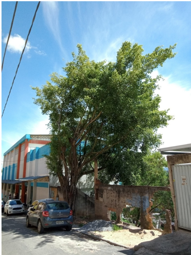
5.2. Visão da árvore inclinada com copa volumosa desequilibrada, fixada próxima a unidade escolar.

Rua Agripino de Oliveira, 60, Independência, Cachoeiro de Itapemirim, ES, CEP: 29306-450 Tel: (28) 3155-5327 / e-mail: semma@cachoeiro.es.gov.br site: www.cachoeiro.es.gov.br/servicos