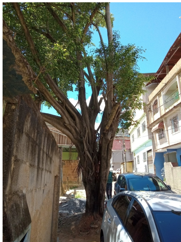
5.5. Visão lateral da árvore fixada em calçada, demonstrando certa inclinação à área terreno/escolar sob cota inferior à esquerda.