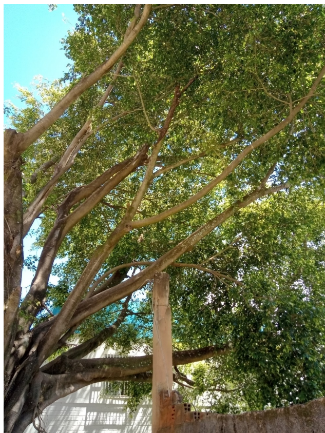
5.4. Visão frontal da árvore apoiada em coluna de muro. Boa parte dos ramos estão unilaterais.

Rua Agripino de Oliveira, 60, Independência, Cachoeiro de Itapemirim, ES, CEP: 29306-450 Tel: (28) 3155-5327 / e-mail: semma@cachoeiro.es.gov.br site: www.cachoeiro.es.gov.br/servicos