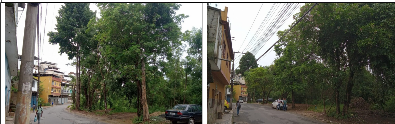
Figura 2. Imagem à esquerda: Trecho arbóreo no sentido do bairro Aquidabam. Destaque de algumas árvores para poda no trecho informado.