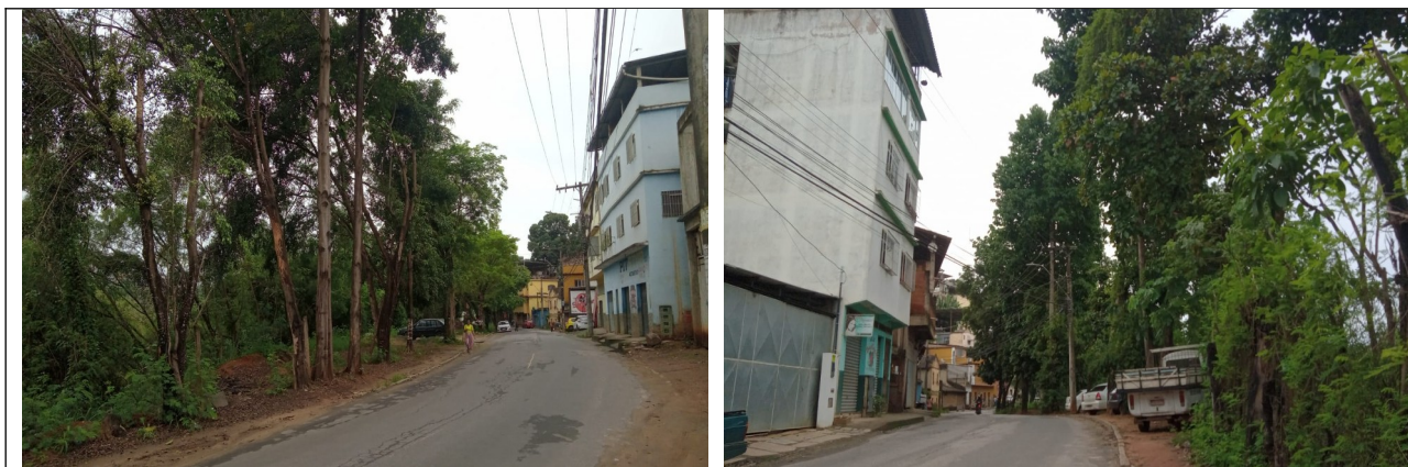
Figura 3. Imagem à direita: Trecho arbóreo no sentido do bairro Rubem Braga. Destaque de algumas árvores para poda no trecho informado.