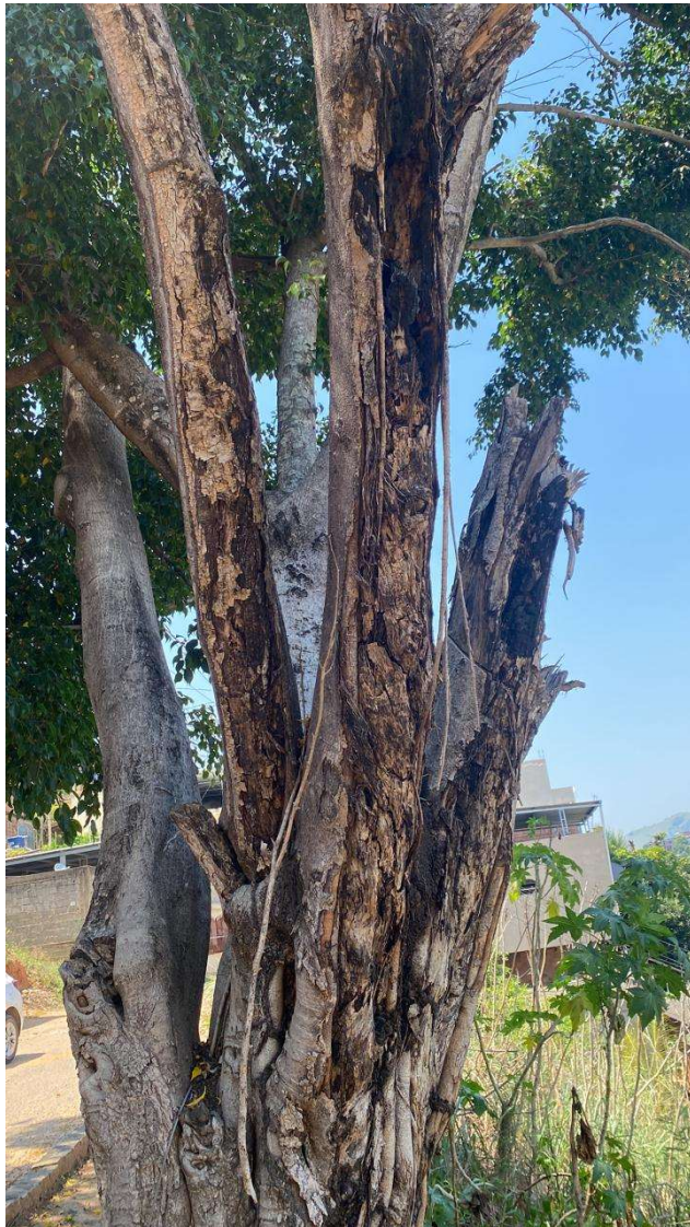
Figura 3. Figueira com sinais de estado de declínio. Observa-se proliferação de pragas e doenças.