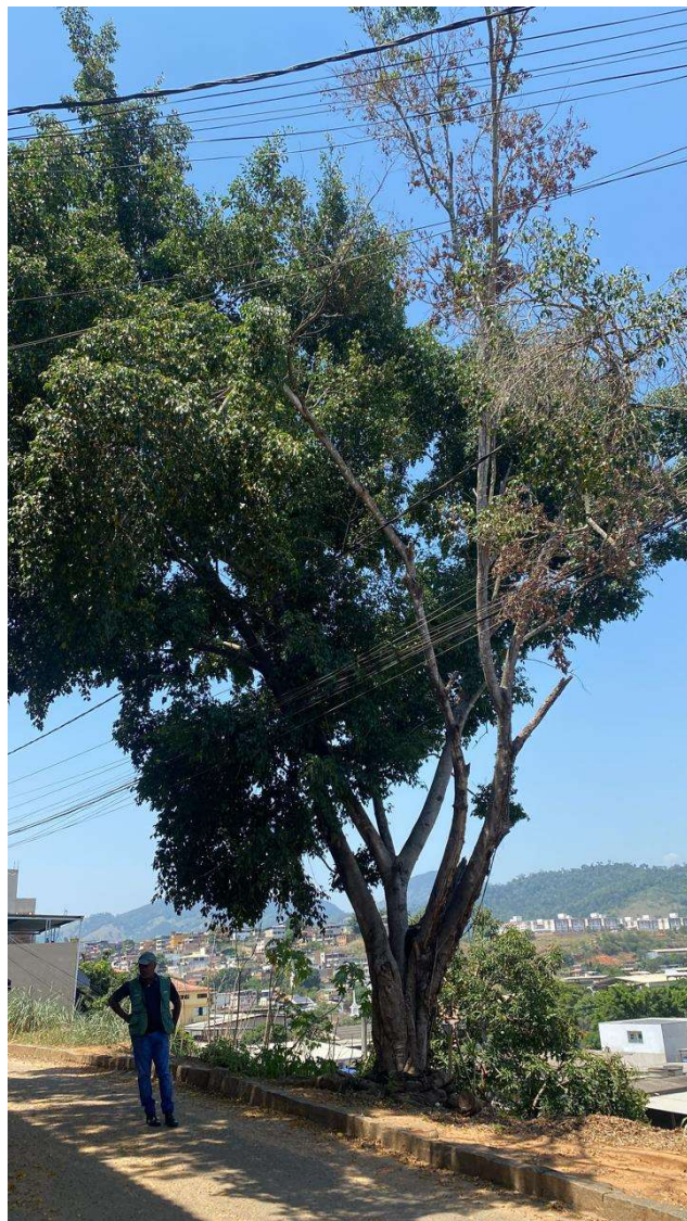
Figura 1. Visão geral da figueira. É possível observar a copa desequilibrada, com desfolha irregular, presença de galhos secos/rompidos e conflito com a rede elétrica.