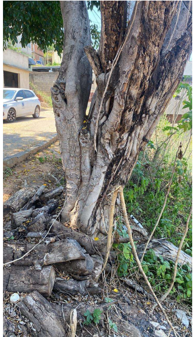
Figura 4. Figueira com sinais de estado de declínio. Observa-se leve inclinação do tronco para o lado oposto da via.

Dessa forma, considerando que as árvores estão em fitossanidade ruim/péssima, com ataque de pragas/doenças, em avançado declínio e, conseqüentemente, com grande possibilidade de queda, sugere-se o deferimento do pedido de supressão. Recomenda-se como compensação a reposição de dois indivíduos arbóreos nativos de Mata Atlântica e de porte a definir. Orienta-se que as árvores sejam plantadas, preferencialmente , na mesma rua, ou em outro local próximo do mesmo bairro , observando que o passeio público deverá ter pelo menos 2,0 metros de largura. Os plantios deverão ser acompanhado pela Gerência de Recursos Naturais para orientação técnica.