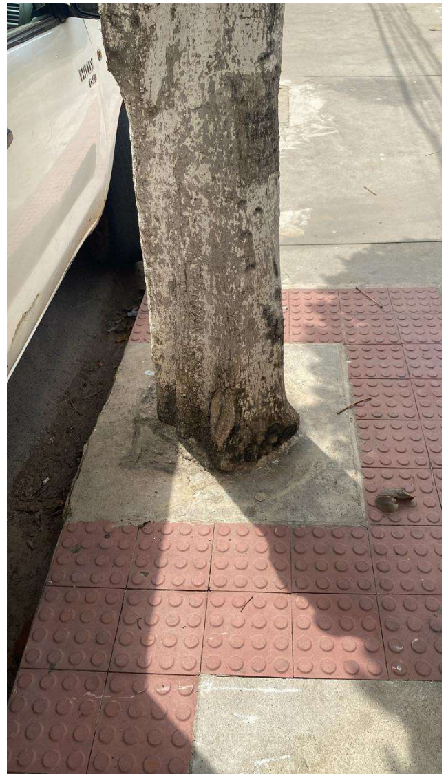
Figura 4. Recomenda-se realizar a abertura da área livre permeável para minimizar futuros danos na calçada.