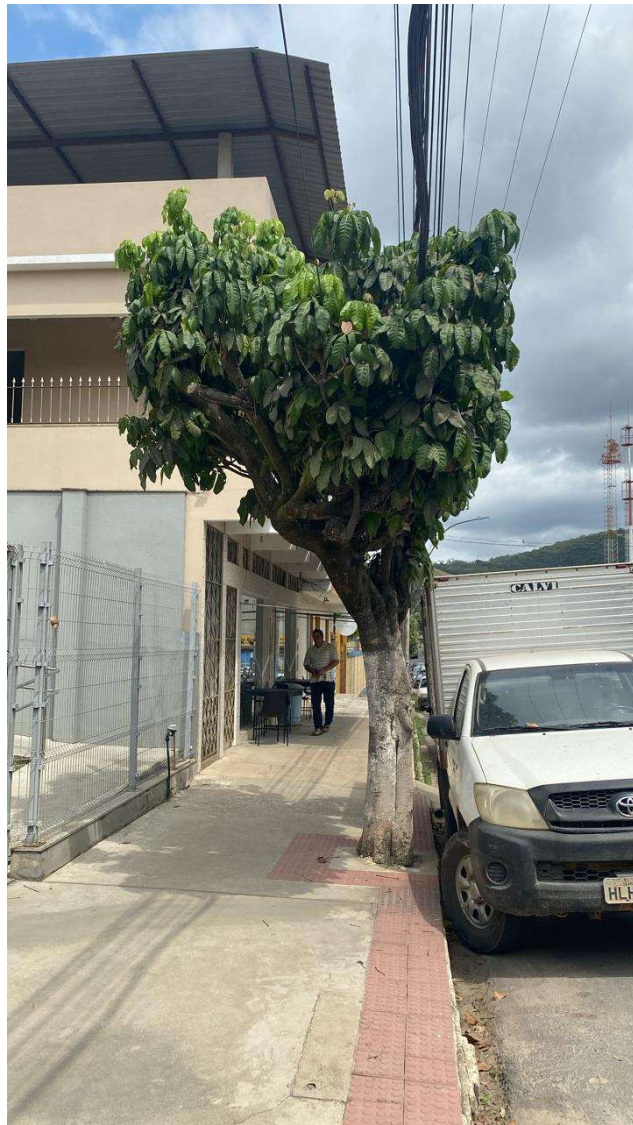
Figura 3. Castanhola em bom estado fitossanitário. Não foi verificado risco de queda e/ou outros motivos que justifiquem a remoção.