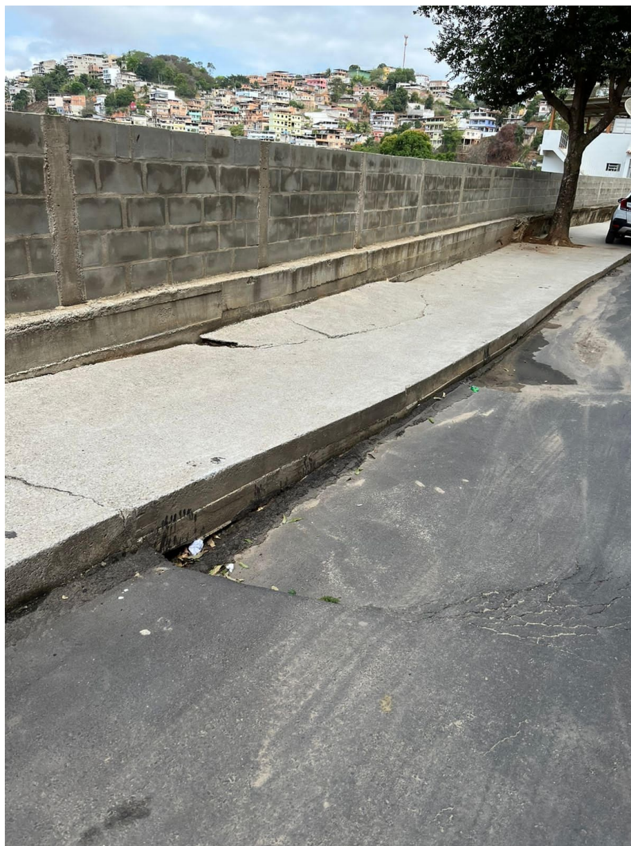
IMAGEM DO LOCAL .