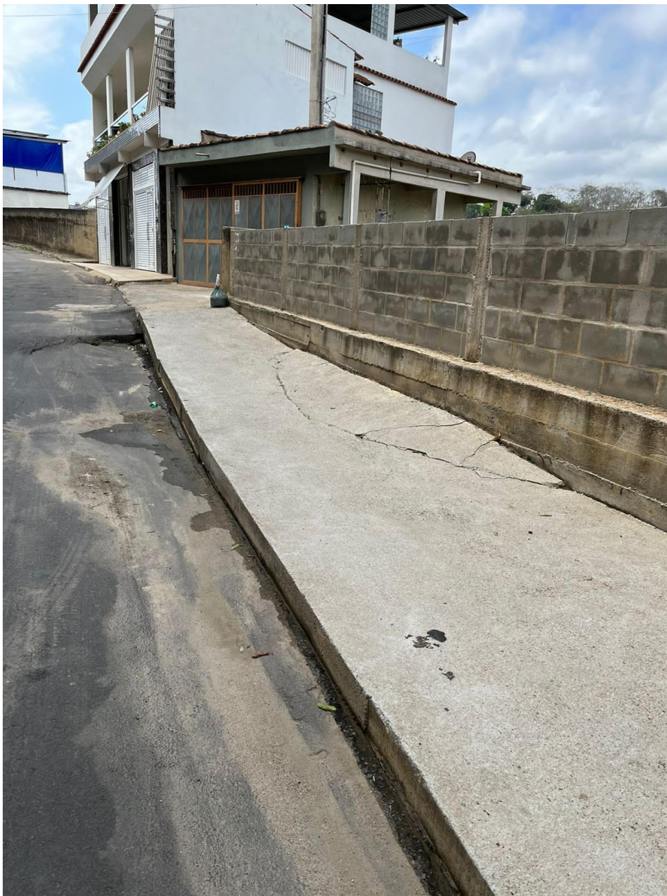
IMAGEM DO LOCAL.