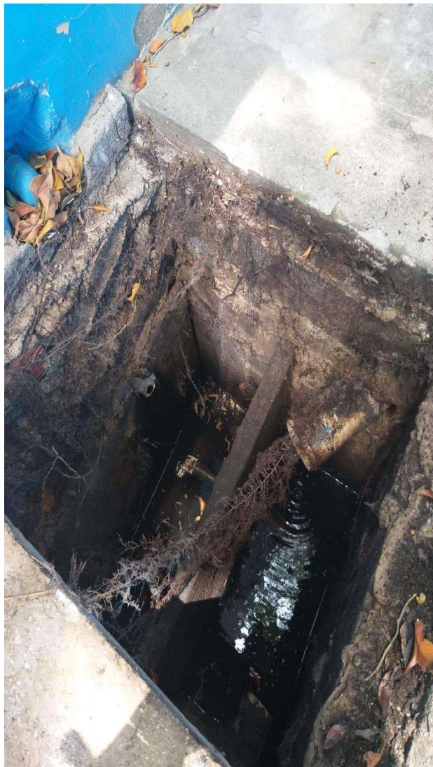
Figura 2. Observa-se parte do sistema radicular da figueira invadindo a tubulação de esgoto/água.

Rua Agripino de Oliveira, 60, Independência, Cachoeiro de Itapemirim, ES, CEP: 29306-450 Tel: (28) 3155-5327 / e-mail: semma@cachoeiro.es.gov.br site: www.cachoeiro.es.gov.br/servicos