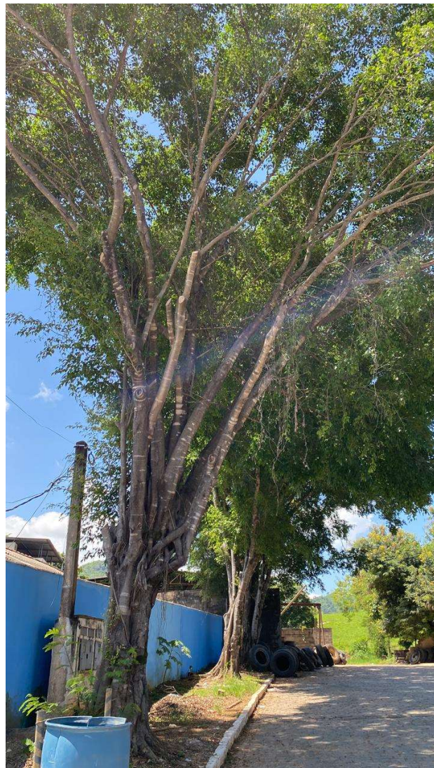
Figura 3. Visão geral das figueiras.