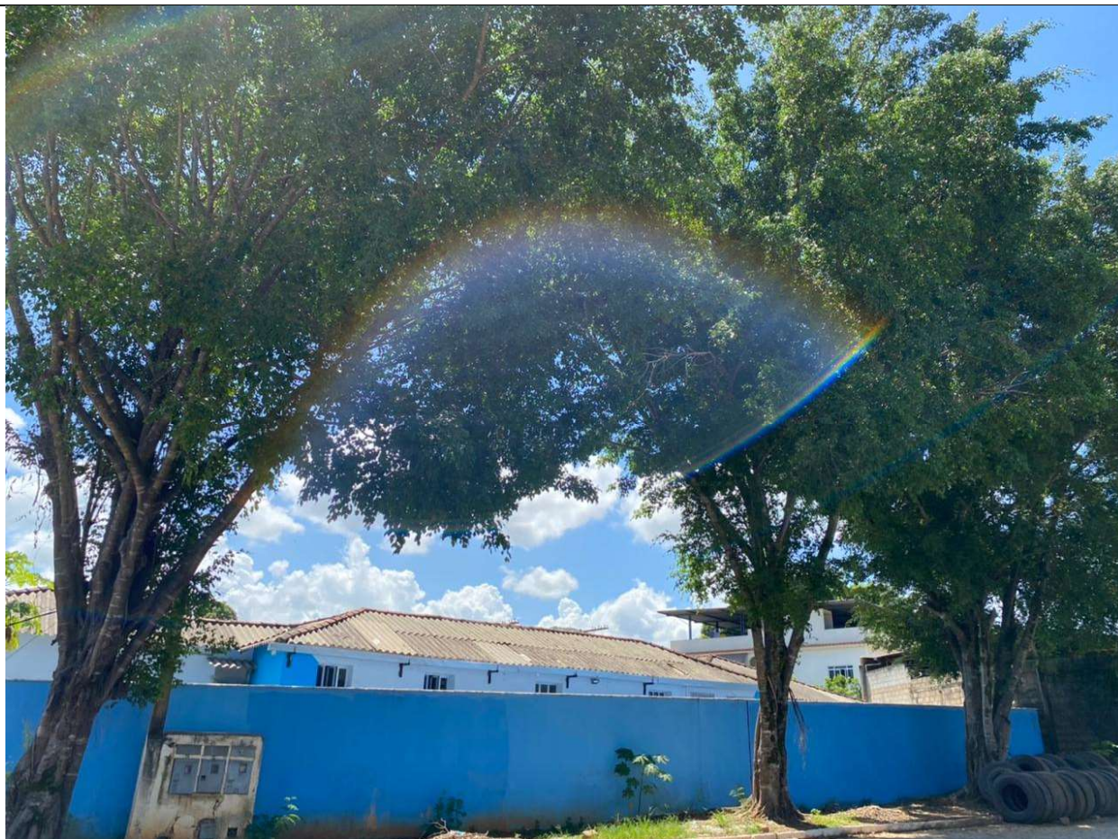
Figura 4. Visão geral das figueiras.