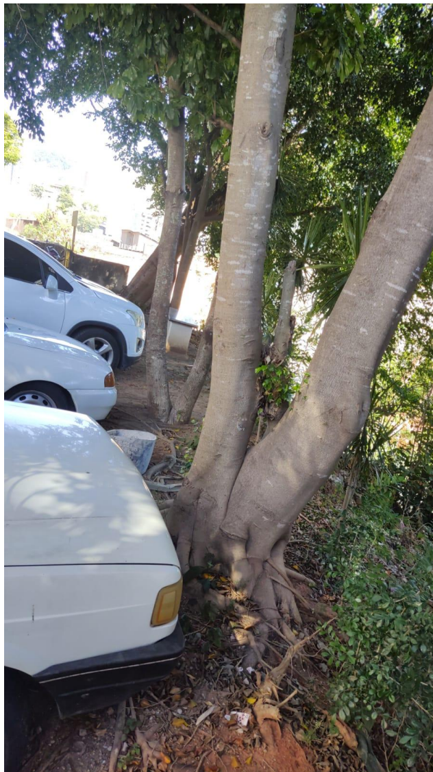
5.3. Disposição das árvores.