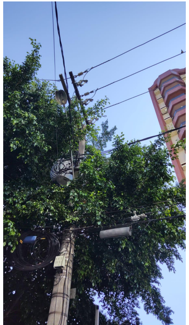
5.4. Conflito com poste e rede de energia elétrica (figueira).