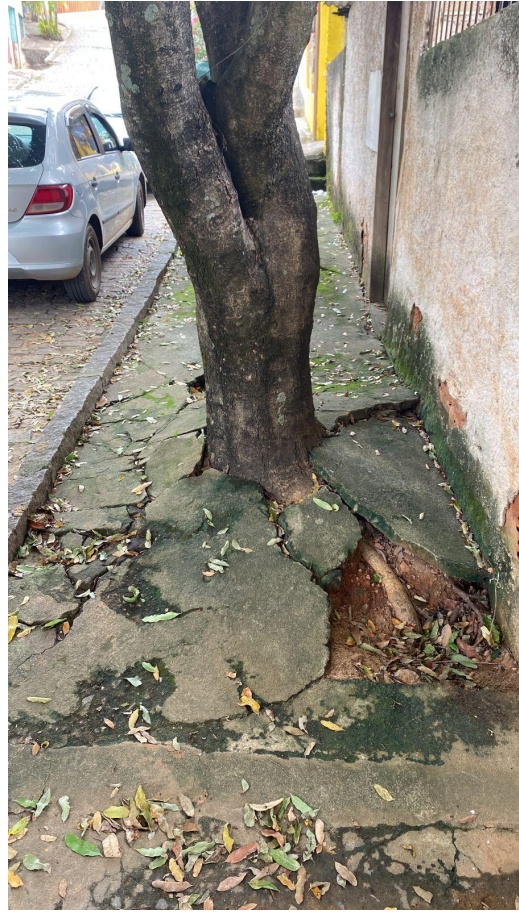
Foto 5. Oitizeiro 2 - Sistema radicular crescendo de forma superficial e destruindo a calçada e o muro da residência. (Data da foto: 06/12/2022). Deferimento.