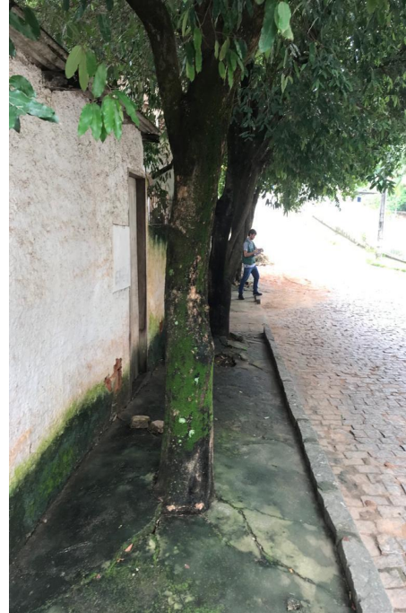
5.9. Oitizeiro 4. Sugestão de realização de poda de manutenção. Adequação da área livre permeável. (Data da foto: 04/03/2020).