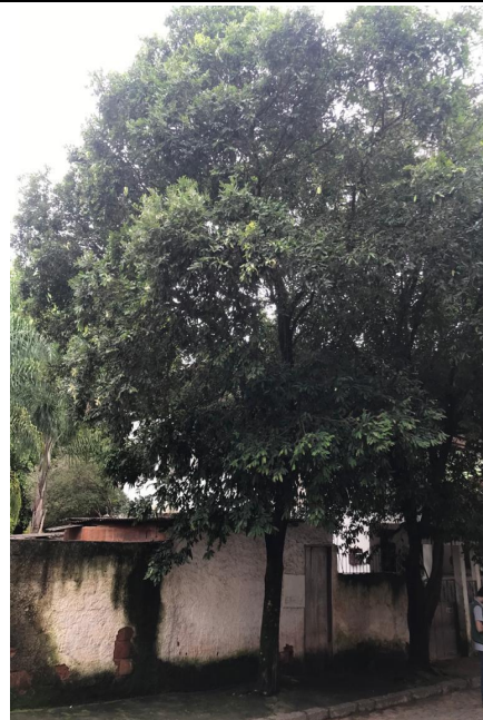
5.10. Oitizeiros 3 e 4. Sugestão de realização de poda de manutenção. (Data da foto: 04/03/2020).