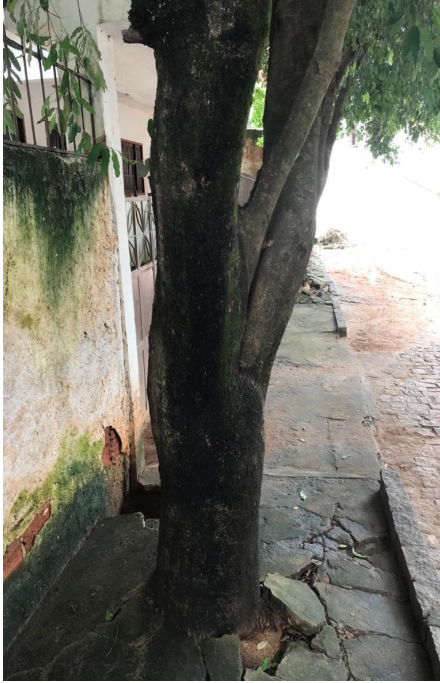
5.8. Oitizeiro 3. Sugestão de realização de poda de manutenção. Adequação da área livre permeável. (Data da foto: 04/03/2020).

Rua Agripino de Oliveira, 60, Independência, Cachoeiro de Itapemirim, ES, CEP: 29306-450 Tel: (28) 3155-5327 / e-mail: semma@cachoeiro.es.gov.br site: www.cachoeiro.es.gov.br/servicos