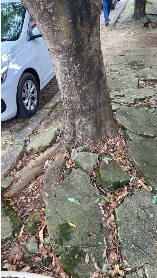
Foto 4. Oitizeiro 2 - Sistema radicular crescendo de forma superficial e destruindo a calçada e o muro da residência. (Data da foto: 06/12/2022). Deferimento.