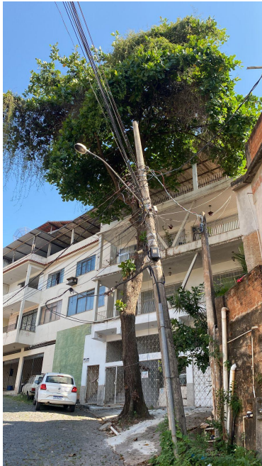
Foto 01. Visão geral da árvore.

A árvore possui diâmetro (DAP) de 55,0 cm e altura total (HT) de, aproximadamente, 17,0 metros. A castanheira-da-praia está em bom estado fitossanitário, não causa danos na rede de distribuição de água, não causa danos na rede de coleta de esgoto, não causa danos na rede de energia elétrica. A copa da árvore apresenta infestação com erva-de-passarinho, portanto sugere-se realizar poda de limpeza.