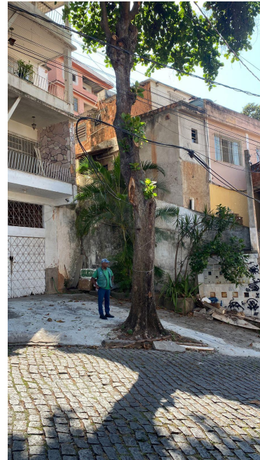
Foto 02. Espaço amplo para passagem de pedestres.