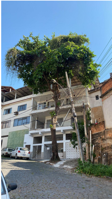
Foto 03. Necessidade de poda de limpeza.