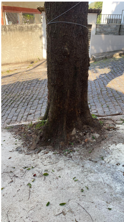
Foto 05. Necessidade de adequação da área livre permeável.