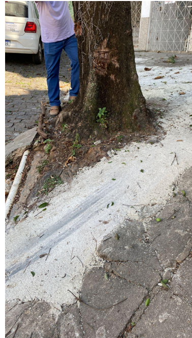
Foto 04. Necessidade de adequação da área livre permeável.