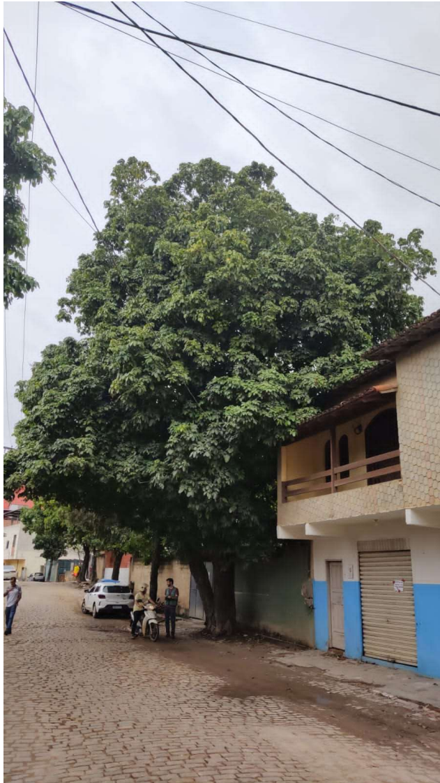
Figura 2. Visão geral das árvores. Observa-se a copa conflitando com a fiação elétrica.

Rua Agripino de Oliveira, 60, Independência, Cachoeiro de Itapemirim, ES, CEP: 29306-450 Tel: (28) 3155-5327 / e-mail: semma@cachoeiro.es.gov.br site: www.cachoeiro.es.gov.br/servicos