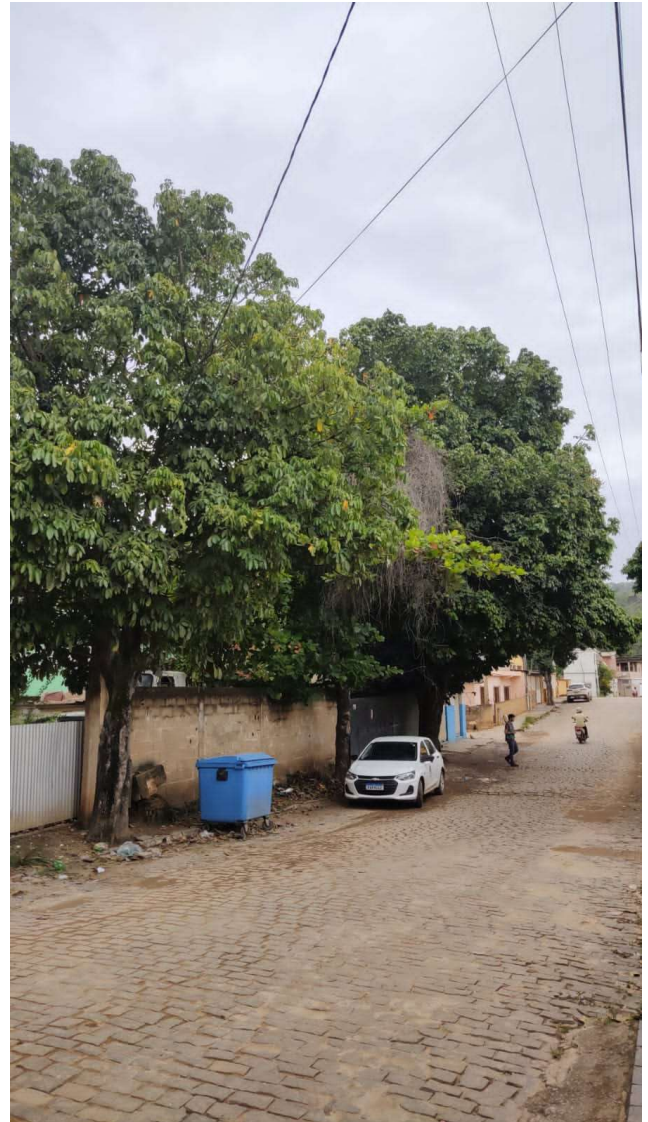
Figura 3. Visão geral das árvores. Observa-se a copa conflitando com a fiação elétrica.