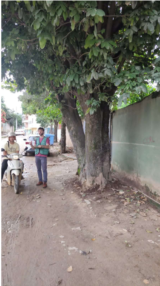
Figura 4. Árvores inseridas em área pública.

Rua Agripino de Oliveira, 60, Independência, Cachoeiro de Itapemirim, ES, CEP: 29306-450 Tel: (28) 3155-5327 / e-mail: semma@cachoeiro.es.gov.br site: www.cachoeiro.es.gov.br/servicos