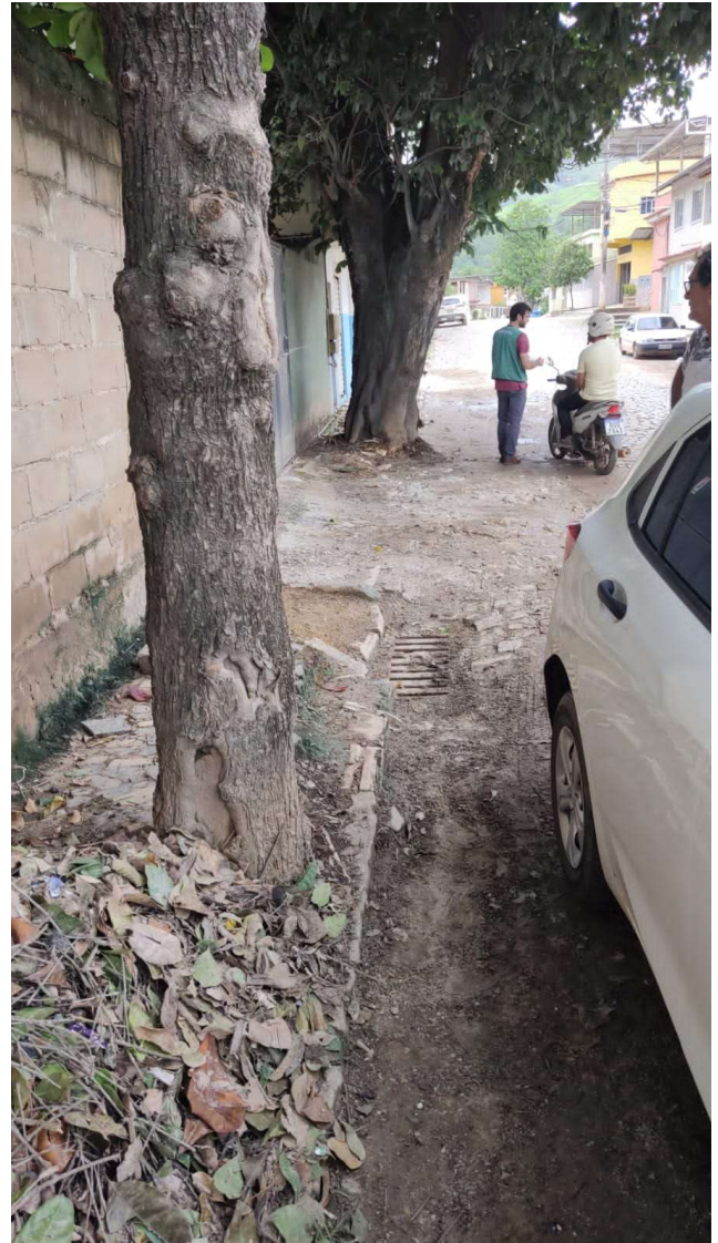
Figura 5. Observa-se que as árvores estão inseridas próximas do bueiro.

Diante do exposto, recomenda-se aguardar a Secretaria de Manutenção e Serviços comunicar a realização da intervenção necessária na via para uma nova vistoria técnica, visando verificar se a obstrução das redes de manilha existentes e o alagamento da via estão sendo causados pelo sistema radicular das árvores. Orienta-se ainda que a munícipe faça um registro fotográfico das redes de manilha quando a SEMMAT realizar a intervenção na via para embasar pedidos futuros, caso seja necessário.