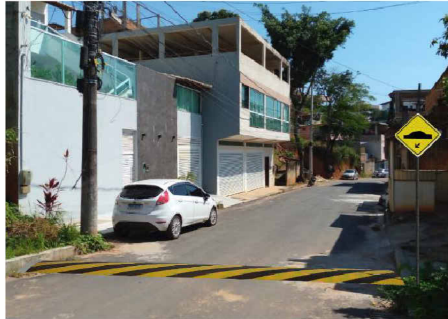
3 PERSPECTIVA SEM ESCALA