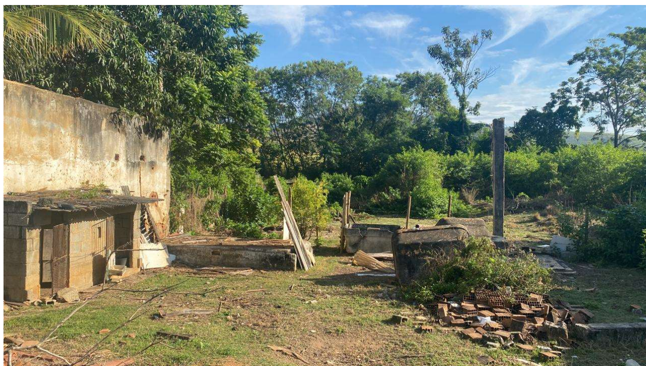
Figura 3: Entrada para o curso hídrico. Presença de lixo urbano e entulhos. Aos fundos, é possível visualizar indivíduos arbóreos margeando o córrego.