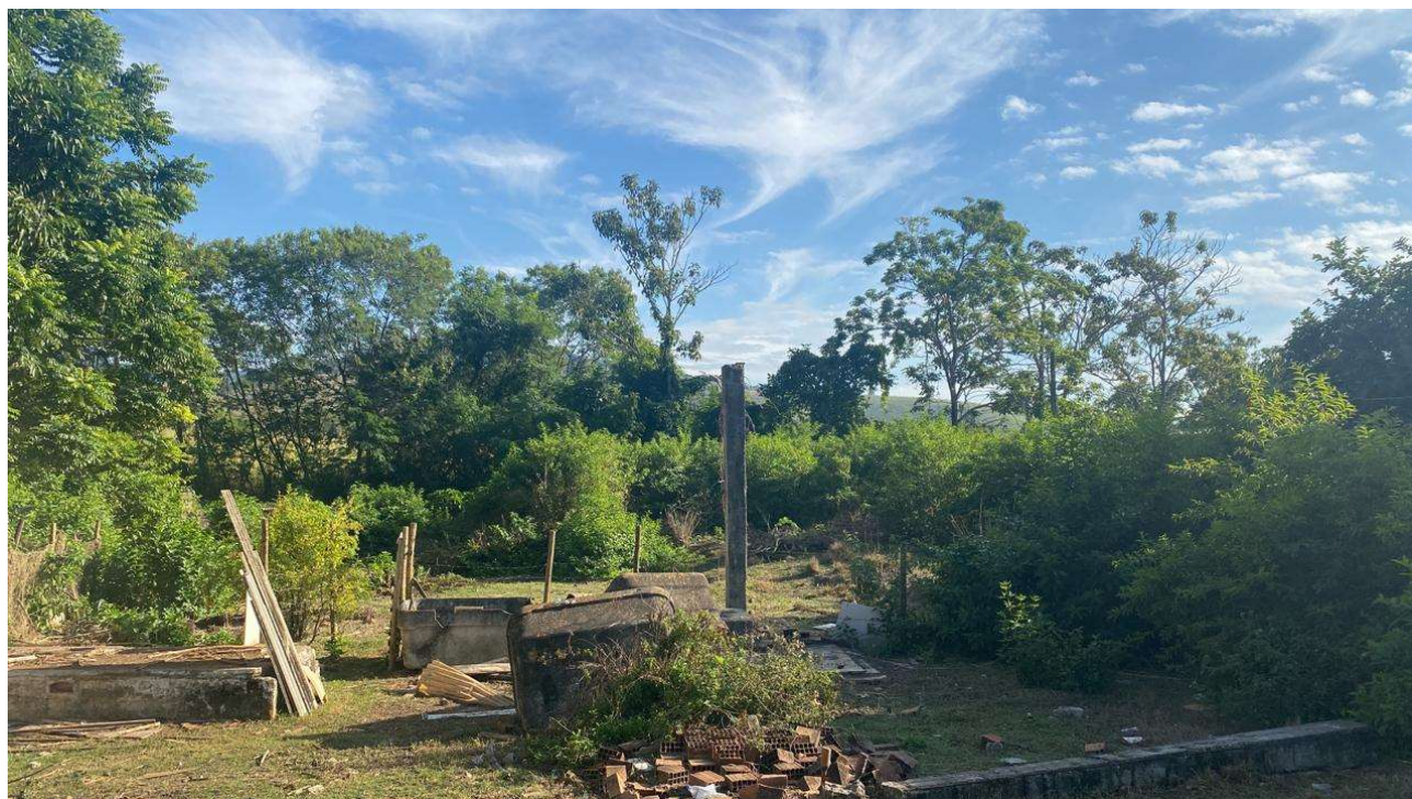
Figura 2: Entrada para o curso hídrico. Presença de lixo urbano e entulhos. Aos fundos, é possível visualizar indivíduos arbóreos margeando o córrego.