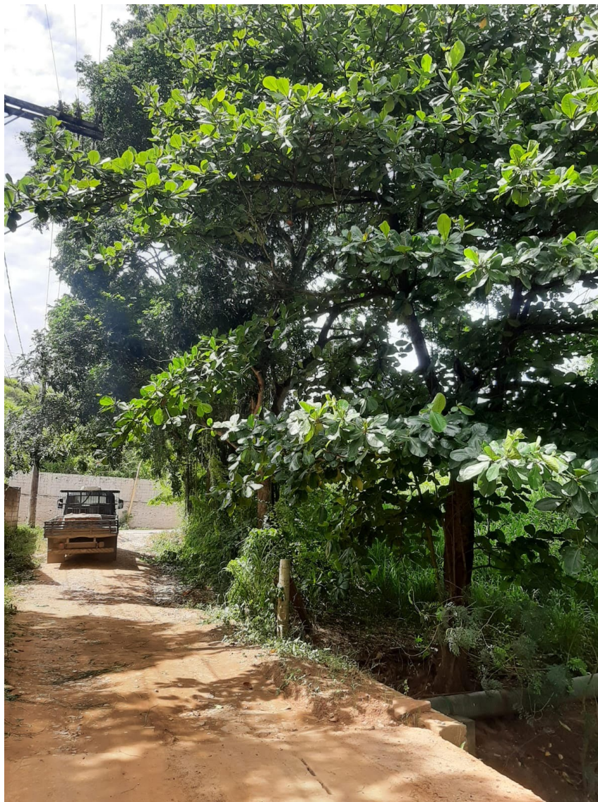
Imagem do Local.