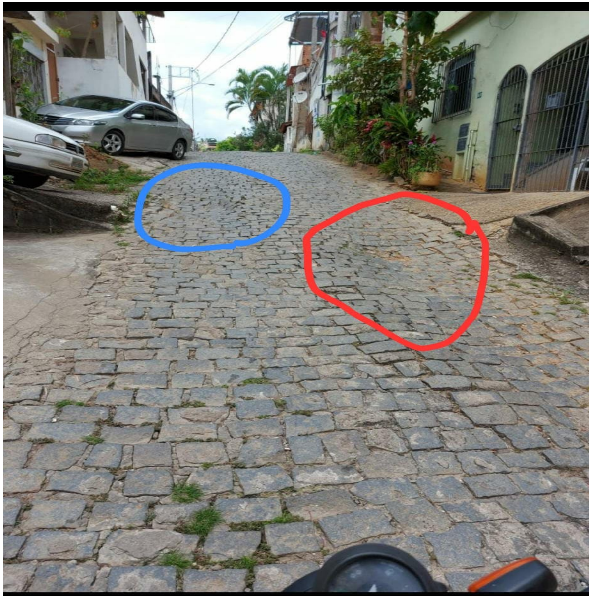
Imagem do Local.