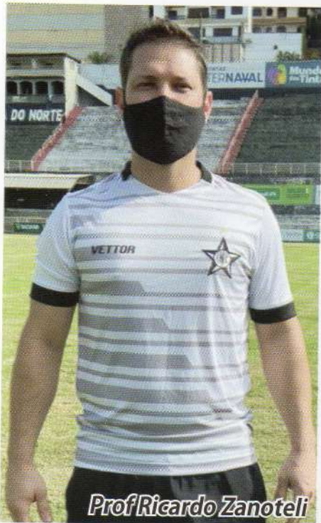
Prof Ricardo Zanoteli

Será voltada, inicialmente, para crianças de 6 a 13 anos de idade, no próprio campo do Estrela do Norte – Estádio Mário Monteiro (Sumaré) – com treinos/aulas terças e quintas-feiras pela manhã e também à tarde.