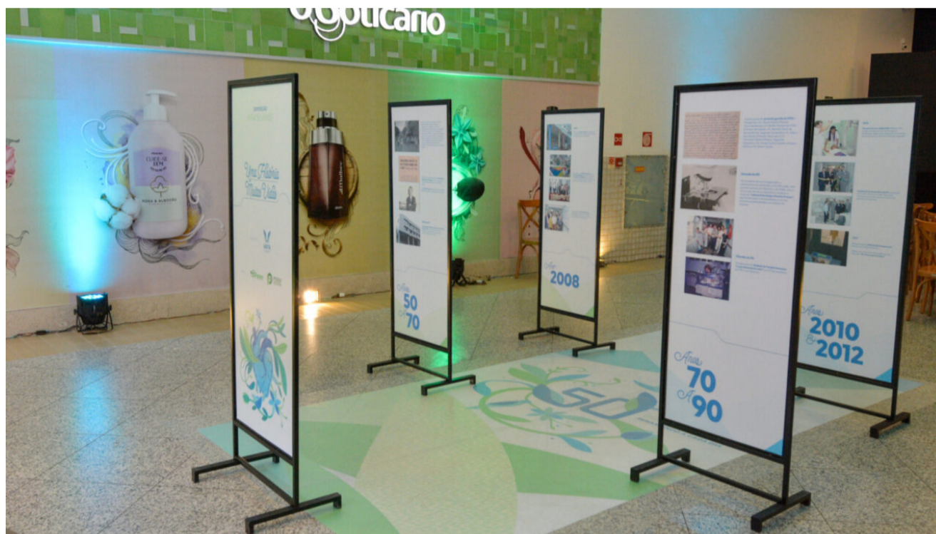
A exposição conta os 50 anos do HIFA e ficará no Perim Center durante todo o mês de julho

Cultura - 1 de julho de 2021 Assessoria de Comunicação