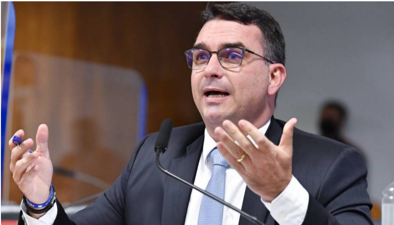
Parlamentar afirma que denúncias na Saúde são 'infundadas', defende Ricardo Barros e sustenta que governo seguirá alinhado ao bloco

Política - 2 de julho de 2021 Assessoria de Comunicação