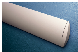
WK - 80