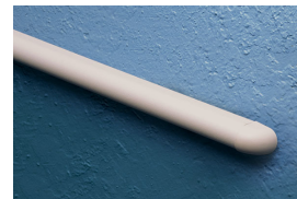
WK - 125