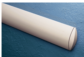
WK - 50